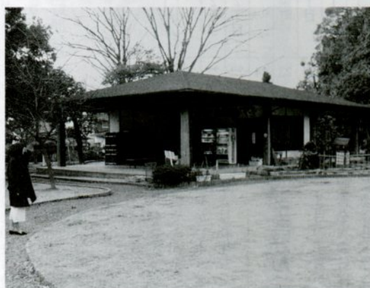
上町・樗谿公園内の休憩施設「梅鯉庵」

市公園協会は、休憩施設として樗谿公園に「梅鯉庵」、行徳緑地に「行徳苑」、港町に「リバーフレンド鳥取」を運営しています。気軽にご利用下さい。申し込み先と利用料金は次のとおりです。