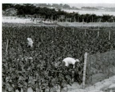
湖山池湖畔の葉タバコ畑

分」や「火に興味をもって」遊んでいるうち火災になったものです。 マッチやライターなどは、子供の目につかない所に置き、出すのは危険です。