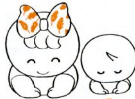
愛ちゃんと希望くん