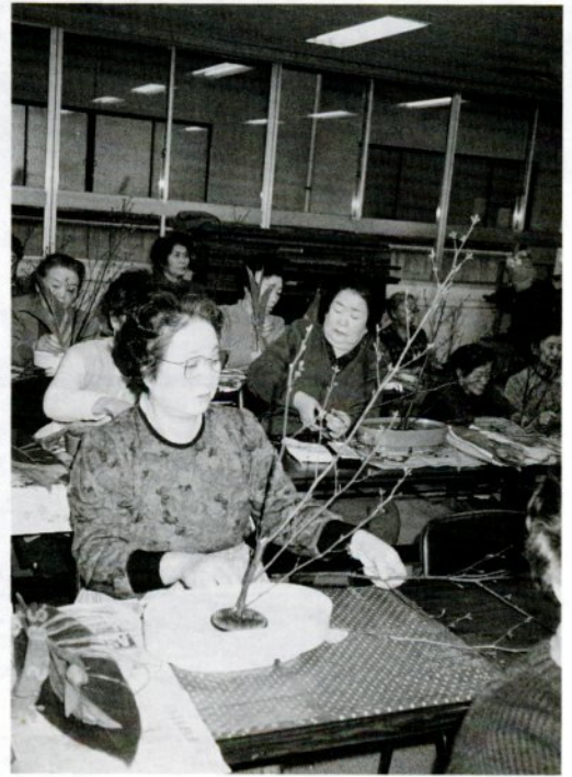
「趣味の教室」で生け花を習う会員たち