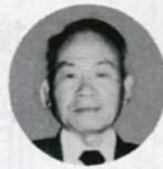
一 本大会には 正 全国から同和 岸 本教育に携わっ ている関係者

約一万六千人が参加、本県始まって以来最大規模の大会となりました。二十日の午前中は全体会で、主催者を代表して門田全同教委委員長が開会のあいさつをしました。