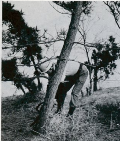
砂丘保安林の伐採をする作業員

鳥取砂丘の風紋をよみがえらそう、と市は十二月一日、砂丘保安林の伐採を開始しました。