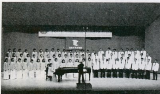
結成20周年を記念して12月4日に開かれた鳥取市民合唱団演奏会 (市民会館で)