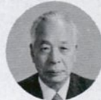
己 今大会の内容を勝ち取る研究であり、その過程における実践の尊い記録でもありました。

字が読めない書けない父さん、母さんが、子供にはちやんと勉強してほしい、と考えるのは、どの親も同じ思いです。体の弱い子を育てているある母親が「薬局でポ