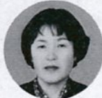
輝子 私は言語認識の分科会に参加しました。発表の内容

容は、被差別部落のひずみを持つ一人の児童と教師とのことばの伝達にかかわる実践が中心でした。ことばの持つ機能に着目し、ことばの上面で判断するのではなく、生活の真実として捕らえさせる実践に共感するものを覚えました。