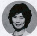
子 私は就学前の分科会に参加しました。討論の柱として

て、①子供たちを取り巻く部落差別の現状を明らかにする②基礎から着実な発達を保障する教育(保育)内容の創造③就学前教育を保障するための条件確立などが掲げられました。なかでも「泣いている子に泣くな、と言うが、泣いている子の心を知る人は少ない」との話に心を打たれました。保育者自身が子供や親の立場になって考え、親の問題を自分のこととして自分の生きざまを変えていくことがたいせつだ、と痛感しました。