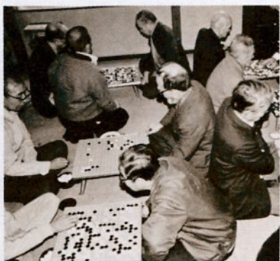
(老人の趣味教室Ⅱ囲碁)