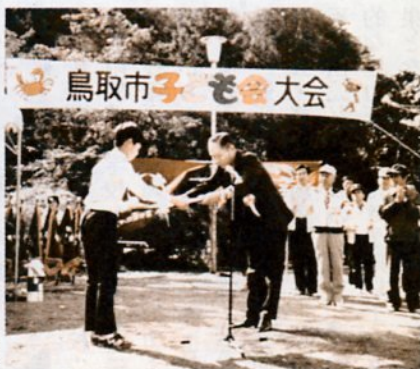
(子ども会大会で表彰)

福祉文化会館の二階に、老人のための機能回復訓練室があり、各種の機具を備えております。