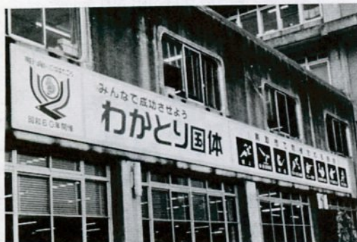
市庁舎に掲げてある広報看板