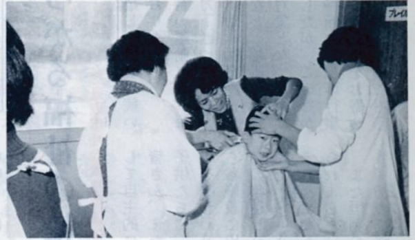
市区町村社会福祉協議会法制化実現署名運動