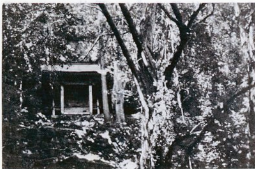
昼なお暗い御熊神社