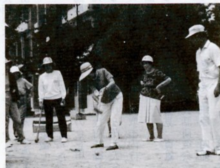
グラウンド・ゴルフに挑戦する主婦ら（東中で）

いるもので、料理教室、史跡めぐりなどを実施しています。今回のグラウンド・ゴルフには地区の主婦ら四十人が参加し、初めての競技に快よい汗を流しながら挑戦していました。