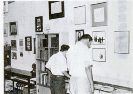
砂丘荘にオープンした「有島武郎記念砂丘文学科学館」

同館は遠山正瑛鳥取大名警教授が提唱し、砂丘荘の一階会議室三十平方メートルを改装し展示室としたものです。記