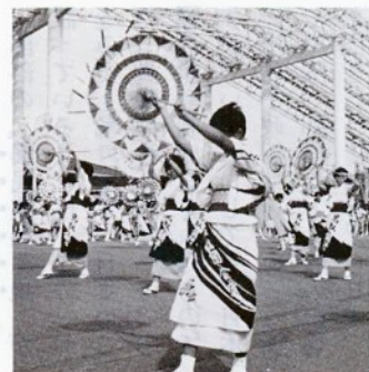
エキスポランドで披露する傘踊り

エキスポランドで開かれた、第二回これが祭りだ、にしやんしやん傘踊りが出演し、観客のアンコールに応えるなど、鳥取の傘踊りを広くPRしました。