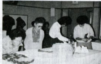
リフォーム作品に見入る働く婦人たち(61年10月、文化祭)

「市働く婦人の家」は、次のグループの会員を募集して開設期間は次のとおり。 バドミントン教室 5月6日(水)から6月5日(金)まで 毎週水、金曜日の午前9時30分～11時30分。 バレーボール教室 5月12日(火)から6月11日(木)まで 毎週火、木曜日の午前9時30分～11時30分。