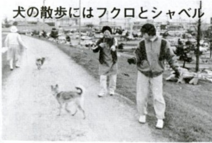
犬の散歩にはフクロとシャベル