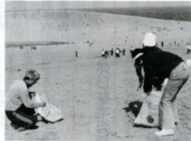
毎回多くの市民が砂丘一斉清掃に参加

ゴミのないきれいな砂丘に実施します。 集合場所は、福部村営レストハウス前の県営駐車場です。 家族そろって参加して下さい。