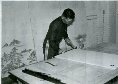
ふすまの張り替え作業を行う人材センターの会員

市シルバー人材センターは、高齢者で入会を希望される人は、家庭や事業所などで仕事を手伝ってもらう適当な人がいないとき、簡単なもので高齢者にふさわしい仕事であれば、心よく引き受けます。 例えば、庭木の剪定、草取り、襖や障子の張り替え、年賀状や結婚式の案内状の表書き、簡単な大工仕事、病人や老人の介護、その他雑用など簡単な仕事なら何でも相談に応じます。 同センターでは、現在約300人の会員が、自己の経験や能力を生かし生きがいとして各分野で楽しく働いています。健康で働く意欲のある高