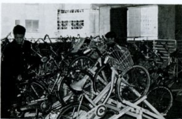
1500台の自転車が収容できる高架上自転車駐車場