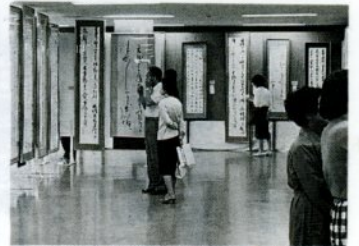
去年の市民美術展で出品作品を鑑賞する市民

日本画、洋画、書道、版画、工芸は福祉文化会館(西町2丁目)で、彫刻、写真、デザインは文化センター展示ホール(吉方温泉2丁目)で展示します。