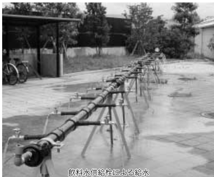
飲料水供給栓による給水