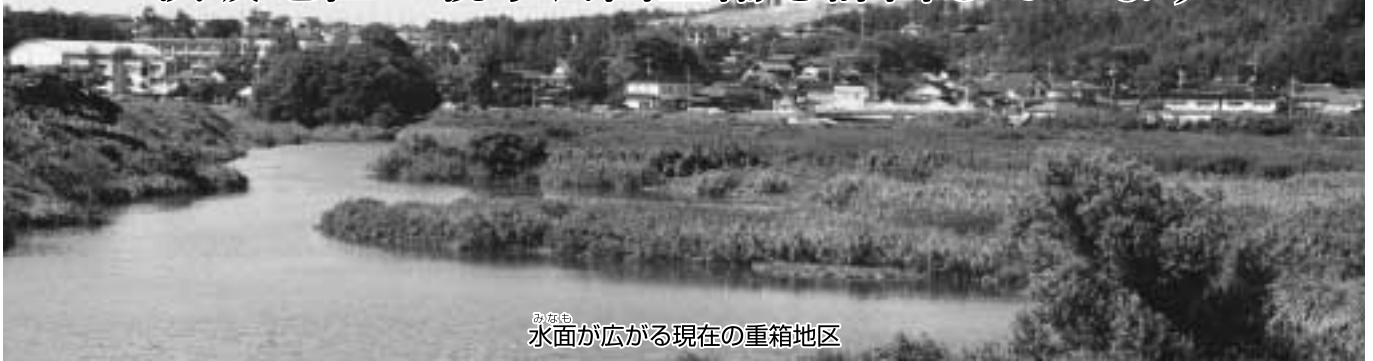
水面が広がる現在の重箱地区