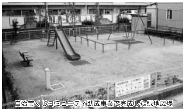
自治宝くじコミュニティ助成事業で完成した緑地広場

4月のごみ収集 4月29日(火)みどりの日は、火・金コース地区の可燃ごみを収集します。そのほかのごみは収集しません。 問い合わせ先 生活環境課(20 3217) 緑地広場が完成 このほど、雇用促進住宅岩倉宿舎隣に、植栽、ベンチ、水飲み場、滑り台などを整備した緑地タイプの広場が完成しました。これらは、自治宝