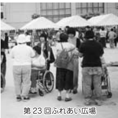
第23回ふれあい広場