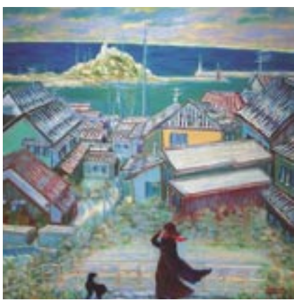
【洋画】市展賞 海 うみ の見える散歩道 さんぽみち