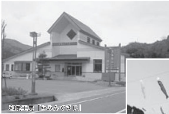
和紙工房「かみんぐさじ」