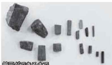
管玉ができるまで ※原石(左上)から完成(右下)までの製作過程

その中に、管玉の製作過程に関する資料を展示しています。管玉は、碧玉 ヒョウキョク という石を使って加工しています。この碧