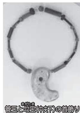
管玉と幻玉(中央下)の首飾り