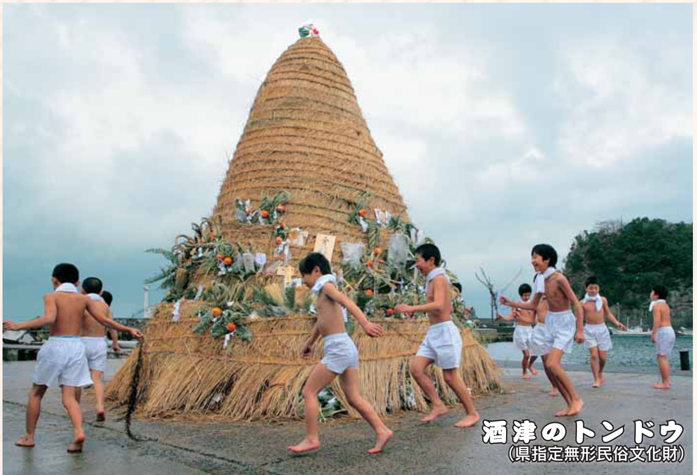
酒津のトンドウ (県指定無形民俗文化財)