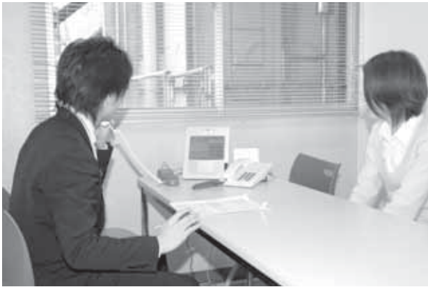
市民総合相談窓口