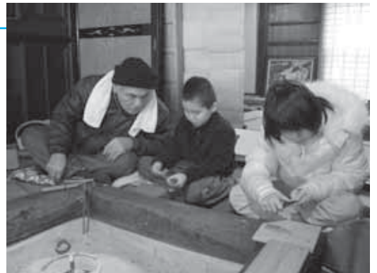
佐治町 B&G 海洋センター

1月8日(月)、城下町鹿野の町屋を改装して作られたまちづくりの活動拠点施設「鹿野ゆめ本陣」で、「七草がゆと竹細工教室」が開催されました。竹細工教室では、昔の正月遊びを今の子どもたちに伝えようと集まった地域のみなさんの指導により、子どもたちが竹とんぼとカッコー笛を製作。はじめは、小刀の使い方もぎこちなかった子どもたちでしたが、徐々に慣れ、完成した作品の出来を喜んでいました。竹細工で遊んだあとは、参加者全員で七草がゆをいただき、今年の無病息災を祈願しました。