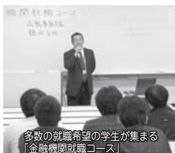
多数の就職希望の学生が集まる「金融機関就職コース」

山陰地域には、一般的にあまり知られていないものさまざまな分野で有力な企業が多数あります。本学で修得した能力を生かし、これらの企業に就職を希望する学生が増えていることから、本学独自の就職情報網などを駆使し、平成19年度から環境政策学科に「山陰地域有力企業就職コース」を開設します。これは、昨年同学科に開設した「金融機関就職コース」に続くものです。