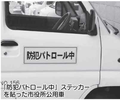
NO.156 「防犯パトロール中」ステッカーを貼った市役所公用車