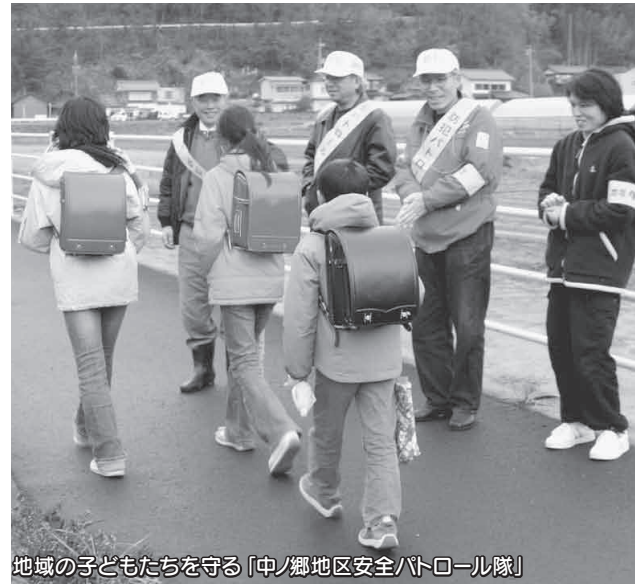
地域の子どもたちを守る「中ノ郷地区安全パトロール隊」