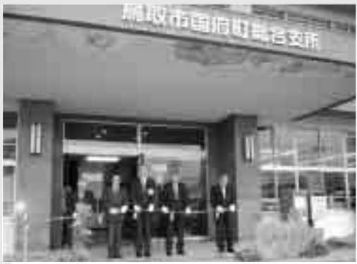
11/1 国府町総合支所 開所式