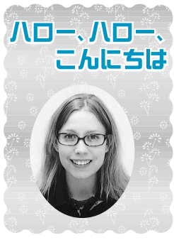
ハロー、ハロー、こんにちは

みなさんこんにちは。春らしい陽気を楽しんでいます。春は出会いと別れの季節といわれています。卒業生に別れを告げ、そして一緒に働いてきた先生方にもお別れを言いました。日本では、春になると一斉に、就職、転職や転職などが行われるのですが、アメリカではこのようなシステムがありません。ですから、多くの日本のみなさんは、この季節になると、期待や不安の入り交じった複雑な思いをなさっているのではないかと思います。さて、合併後、私たちの周りには様々な「変化」が生じましたね。「変化」というものは往々にして、あまり好ましく受け取れないものです。本人にとつても、家族や周りの人たちにとつても、変化が生じた時は、躊躇するものですね。また、慣れ親しんできたものから、