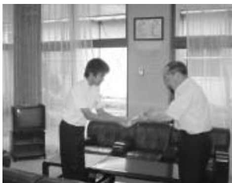
緑の募金にご協力 ありがとうございます

今年3月25日から5月31日まで町内各集落、学校、総合支所などで募集していた緑の募金が341,607円集まりました。皆さんの善意によって寄せられた「緑の募金」は、地域の緑化や森林作りなどに利用され、各地区公民館や小・中学校の緑化推進などに役立てられる予定です。