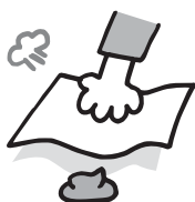
フンの上にちり紙をおく