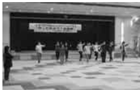
健康づくりに 太極拳

10月22日(土)、23日(日)の2日間、「もちがせふれあいまつり」が開催されました。地域の皆さんの作品展示やフリーマーケットなど、さまざまな催しが行われました。また、同じ日に鳥取県民スポーツ・レクリエーション祭の太極拳大会が用瀬地区保健福祉センター、用瀬中学校を会場に開催されました。200人を超える参加者・観客が集まり、太極拳教室や競技会が行われ、熱のこもった演技が繰り広げられました。