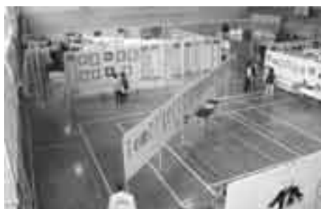
体育館一杯の 作品展示

10月22日(土)、23日(日)の2日間、「もちがせふれあいまつり」が開催されました。地域の皆さんの作品展示やフリーマーケットなど、さまざまな催しが行われました。また、同じ日に鳥取県民スポーツ・レクリエーション祭の太極拳大会が用瀬地区保健福祉センター、用瀬中学校を会場に開催されました。200人を超える参加者・観客が集まり、太極拳教室や競技会が行われ、熱のこもった演技が繰り広げられました。