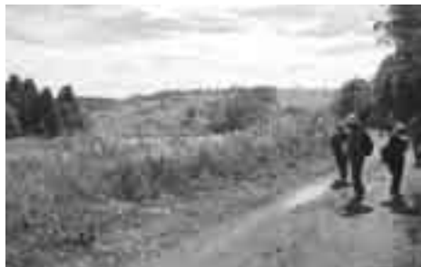
秋晴れの 黒岩高原を散策

10月16日(日)、阿波地区との交流ウォーキングが開催されました。当日は晴天に恵まれ、自己紹介などで親交を深めたあと黒岩高原へ出発し、美しい景色を眺めながら山頂へ。山頂では阿波地区の歴史を学習するなど、楽しい一日を過ごしました。