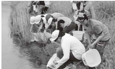
千代川に 稚鮎を放流

y ; l § È ” + % ~ p ; l - ¶ í à \ Ç • t “ @ • E ’ • w “ , L v - U æ ~ • ‡ h { Š s Å S % 5 ^ • ” @ [ T s , n X “ G q w G æ Ö i Ä • q q æ i Ñ £ μ » ~ w 1 3 > l v • E “ Ê ù q È ` o æ ~ • h < w p z r < h j x f • g • Ì - Å t “ , > Ö • o < ' O q @ i > t ‡ h < r l o X “ œ i “ ~ q ` > » Z s U ” • q L v ` ‡ h {