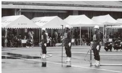
訓練の成果を 堂々と披露

yH s x ç « w, ù i ó â O G q U % 5 ^ • ‡ h { à x ; l • à , > E ` ` o p ü , U Z Ô ` z Ö Æ t x o ` X < , ‡ d œ p ` h U z Ô ] - w Å w R L > ` ô s X C 4 ^ • ‡ h { k ` M Å t “ l h U [ q È x • - p ; ' b h j t † ú > ) Q o X • ‡ b { ™ w • - w B Æ ^ p < G M t p q o o Ö Z ” < w q ¥ M ‡ b {