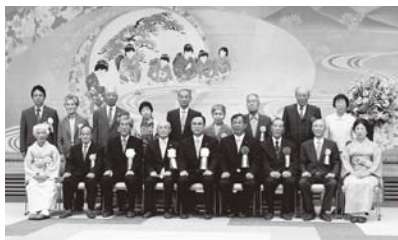
仲むつまじく 夫婦ご円満に

y Ú ~ ¼ à p i Å G æ U I Ü / U ; l • à - H • i » ” p % 5 ^ • z A à ~ à > 4 Q ' • h ] É É U ; l É T ' É Z n ^ • ‡ h { U Û ~ G æ ¼ w q E - É : w Û t M o z Æ æ • - w { T ` M é p > _ o r > ¥ M Z ` h “ z ā w Æ > , ` ‡ • z / “ 4 M s U ' a ] ^ • h f • g • w A \ Æ t ¥ M > ~ d ' • ‡ h {