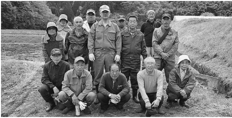
岡営農組合の皆さん