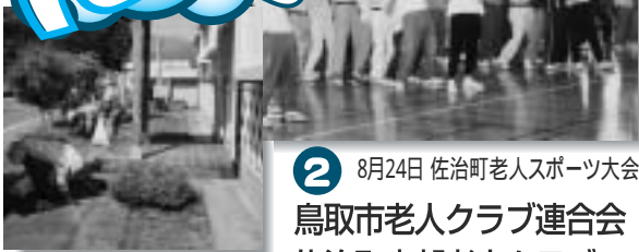
② 8月24日 佐治町老人スポーツ大会 鳥取市老人クラブ連合会 佐治町支部老人クラブ