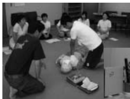
AEDの実習を含めた救命講習会

福祉協議会などの職員を対象に、救命講習およびAED操作説明講習会をこれまで3回開催し、東部消防局職員の指導を受けました。今後は、佐治町で開催されるスポーツ大会などのイベントにも持ち込み、AEDの使用が必要となった場合、住民のみなさんを救うため役立てられます。