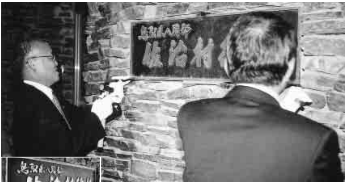
▲「佐治村役場」の銘板を取り外す下石村長（左）、谷上議長（右）