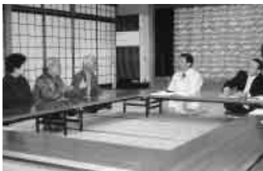
佐治町中央公民館にて

11月22日に、鳥取市長の各地域「集落巡り」が実施されました。山王ふれあい会館、西佐治会館、佐治町中央公民館、そして佐治町