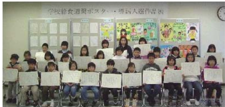
表彰式の様子(1月19日・福祉文化会館)

入選作品は、平成21年1月26日(月)から2月1日(日)まで、鳥取市文化センターに展示されます。