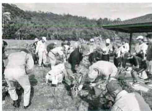
アジサイの植栽(金沢公園)