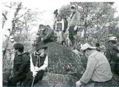
湖南ウォーク(つぶせ岩)