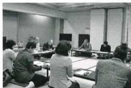
まちづくりフォーラム