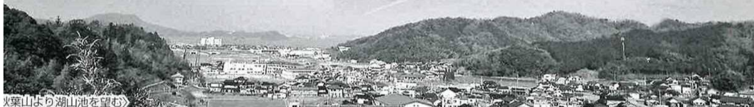
火薬山より湖山池を望む