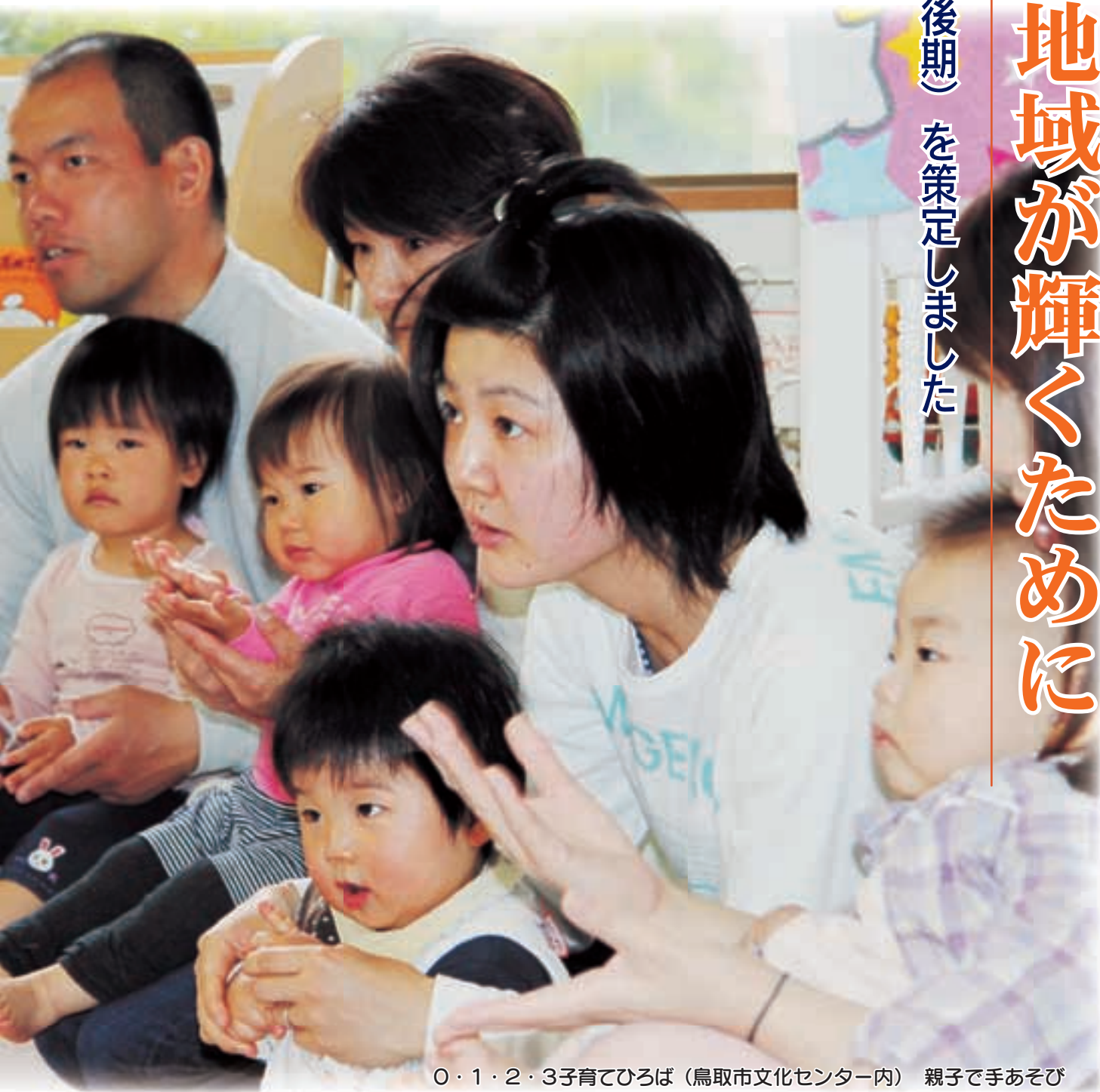
0・1・2・3子育てひろば（鳥取市文化センター内）親子で手あそび

就学前の子をもつ保護者のうち、現在66・2割の母親が就労しており、就労していない人の91・2割が就労を希望しています。小学生の子をも