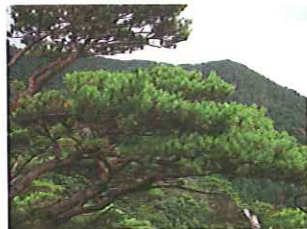
希少種ヒメコマツ