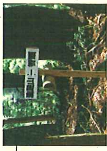
板井原・川中ルート分岐点