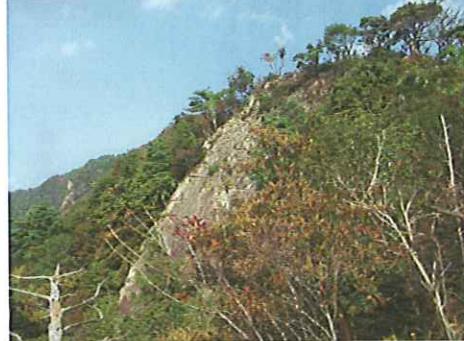
⑥巨大岩壁「鬼の洗濯板」