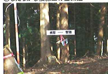
⑧山頂の鳥居野ルート入り口