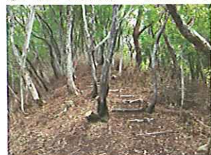
⑦なだらかな稜線上の登山道