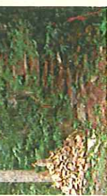
金屋ルート 登山道入り口