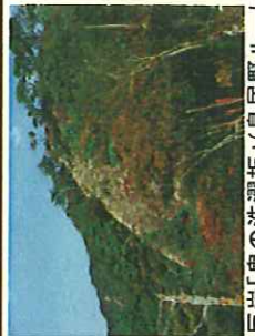
巨岩「鬼の洗濯板」(鳥居野ルート)