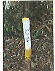
登山道には黄色の杭が30mおきにつけられています。全部で67本ありますので、登山の目安にしてください。