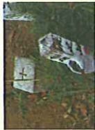
山頂の一等三角点