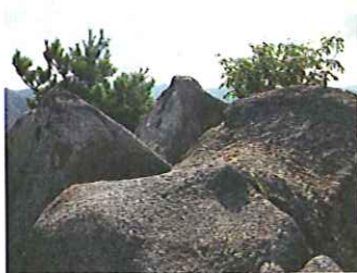
⑤巨岩が重なる珍しい景色です。