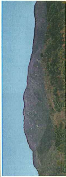
希少種ヒメコマツ(鳥居野)