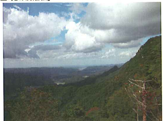
平成23年10月 用瀬町総合支所地域振興課作成