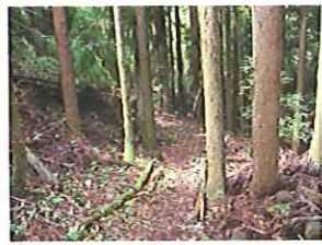
② 最初の山道です。急峻です。