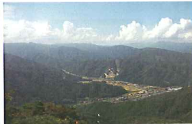
⑥「鬼の洗濯板」より用瀬を眺める