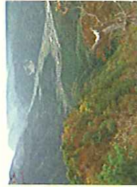
鳥居野ルートより