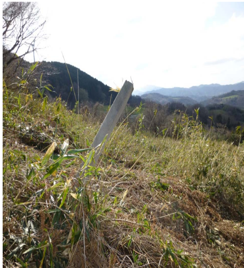
遊歩道のスタート地点