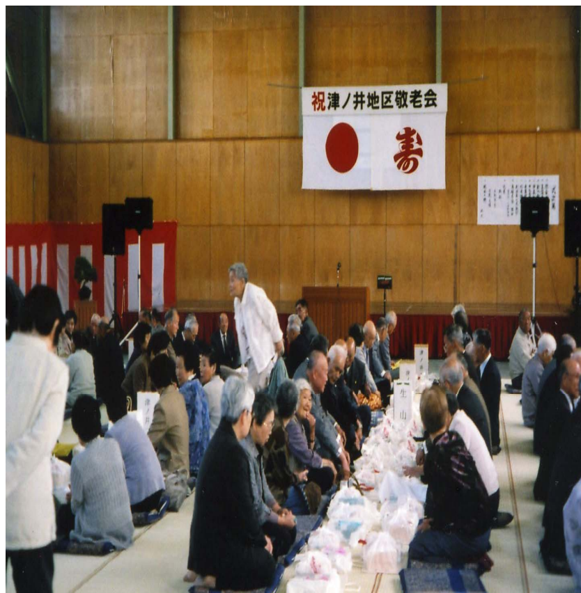
以前の座り席祝宴風景