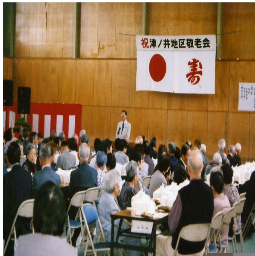
改善後の椅子席祝宴風景