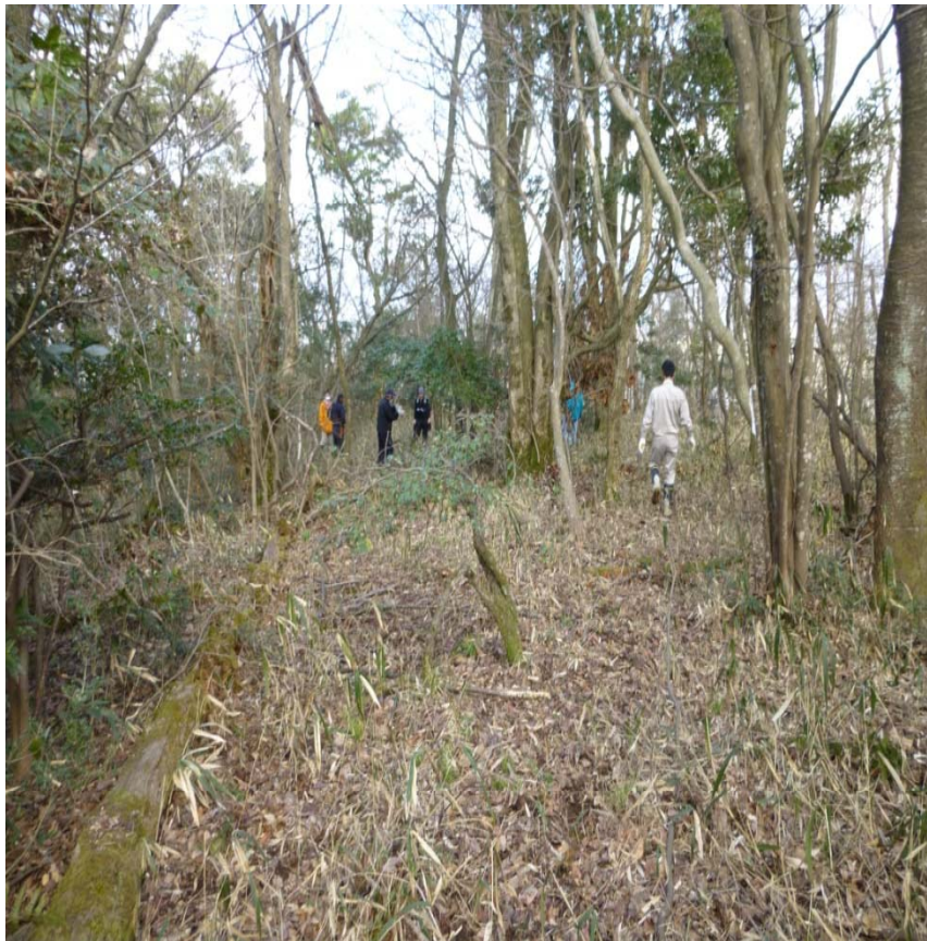
憩いの場所予定地付近