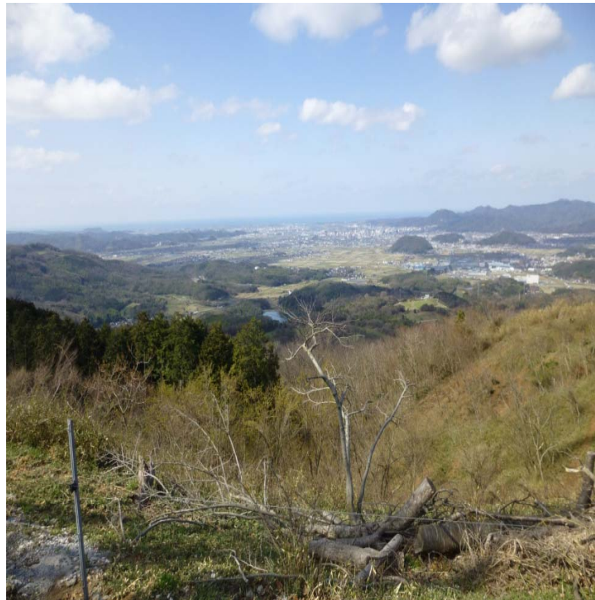
山頂より日本海を望む