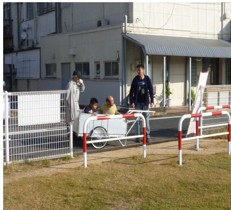
負傷者をリアカーで搬送(旭河部落)