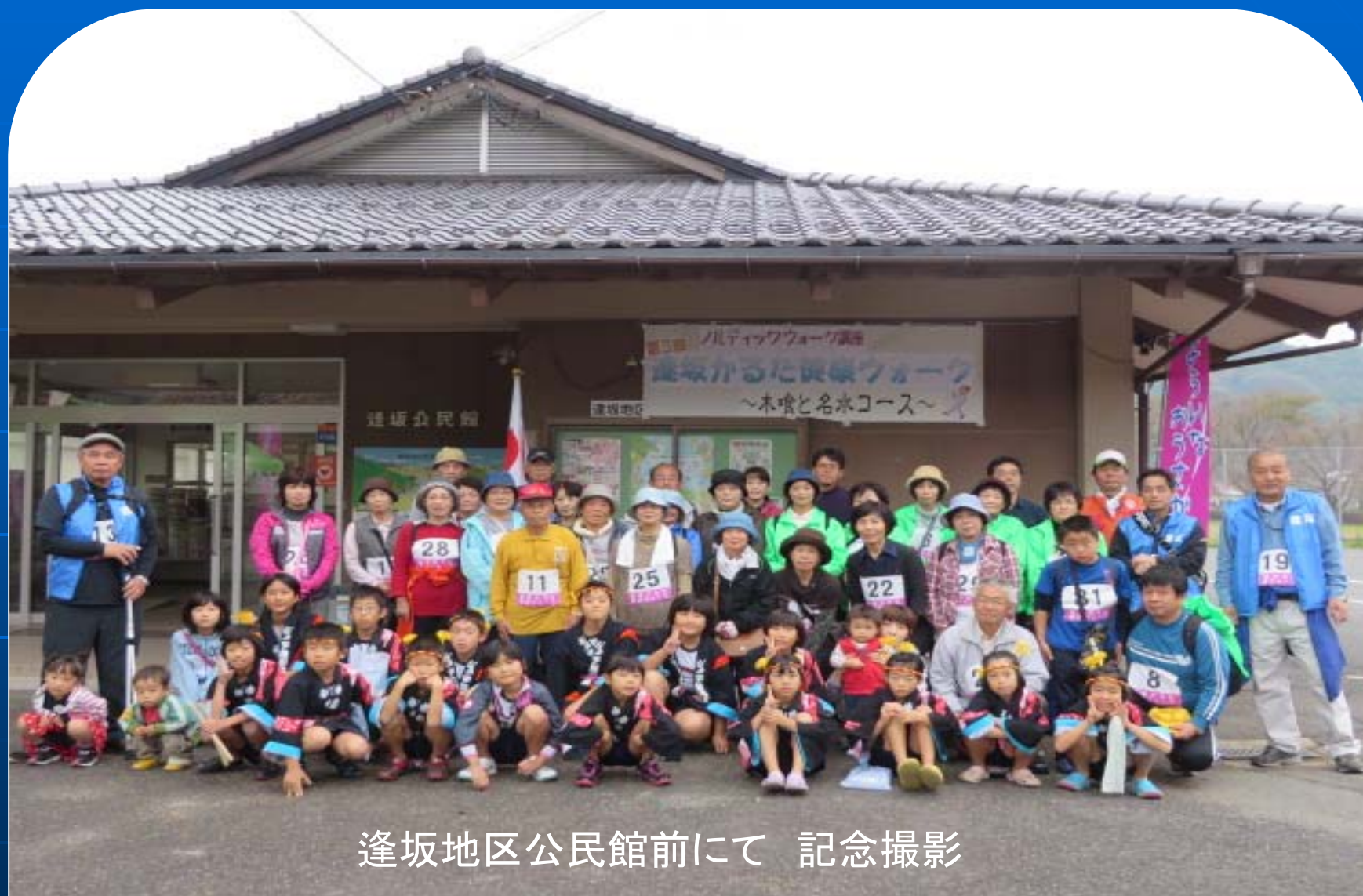
逢坂地区公民館前にて 記念撮影