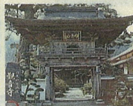
観音寺 県指定文化財「勢至菩薩立像」