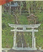
北村神社 鳥取池田藩より家紋・揚羽蝶紋の使用を許可される 万延元年(1860年)