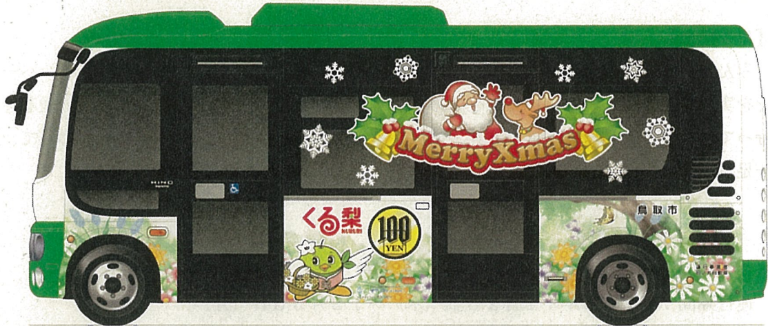
くる梨の画像 (イメージ)