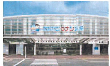
国際会館 特大サイン