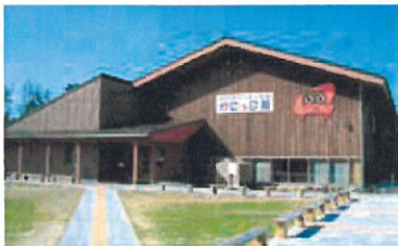
とっとり賀露 かにっこ館