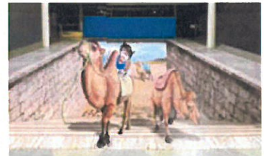
国際会館1F 特大トリックアート