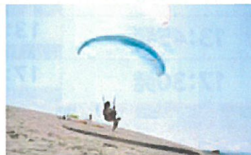
パラグライダー (鳥取砂丘)