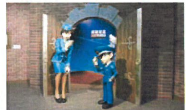
国内線ターミナル到着ロビー ウェルカムスペース