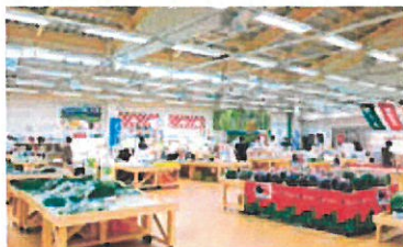
地場産プラザ わったいな