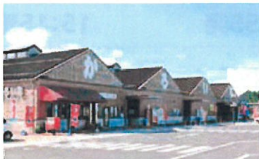
海鮮市場 かるいち