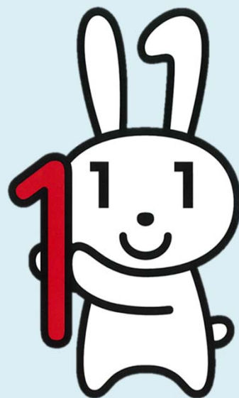
マイナンバーキャラクター： マイナちゃん