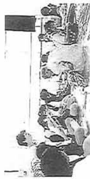
＜＜音笛づくり / 鹿野中＞＞