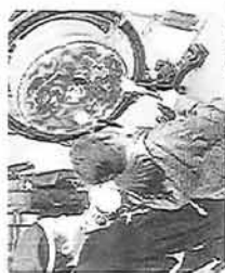
＜＜職業教室 / 鹿野小＞＞