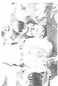
＜＜ちまき作り / こじか園＞＞