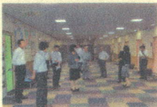
健診待合フロアは 広いスペースを確保

整備することとしていいます。 倉敷市保健所の施設では、保健センター業務も行っており、その隣に子どもからお年寄りまですべての市民が健康で生きがいのある生活を営むための支援施設「くらしき健康福祉プラザ」を有することで、周辺一帯が市民に身近なエリアとなっています。 このたびの視察を参考に、駅南庁舎の整備にあたって保健所に必要な諸室、あわせて整備すべき市民サービス機能について、今後検討していくことにしています。