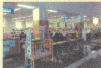
各手続窓口はワンストップ サービスを実現

保健所の関係団体の代表や有識者で構成される保健所設置検討委員会では、現在市民のみならずの健康増進と市民サービスの向上に向けた保健所の在り方について検討しています。5月25日、委員会では、中核市で先進的な取り組みをしている倉敷市保健所を視察しました。 本市は、駅南庁舎に新たな保健所、保健センター、子育て支援機能を集約し、業務の連携強化を図り、保健医療・環境衛生、子育てなどの総合支援の拠点として