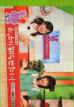
とっとり知らせ隊