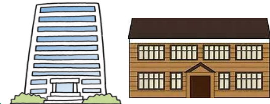
市有施設75施設 (高圧受電) 電力量約650万kWh