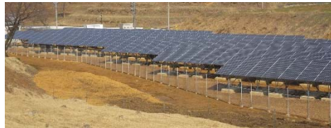
市営いかり原太陽光発電所 平成26年3月運行 (500kW)