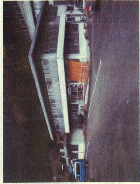
【さくま郷土遺産保存館：統合・廃止】 解体・借地の返還