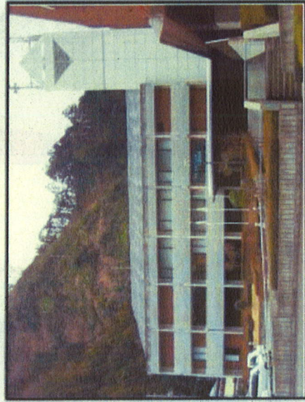
【佐久間協働センター】 ※旧佐久間町役場・ホール