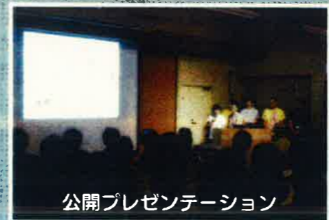
公開プレゼンテーション

民間まちづくり会社などのリノベーションまちづくりの担い手育成の場となるのが、「リノベーションスクール」です。 スクールでは、所有者から提供された遊休不動産を対象に、全国から集まった受講生と国内で先駆的な取り組みを行っている講師（ユニットマスター）が、リノベーションの事業計画を作成し、最終日に所有者に向け公開プレゼンテーションを行います。スクール後は、各提案の実事業化に取り組みます。 本市では、平成26年11月に中国四国地方で初となるスクールを開催し、平成27年7月に第2回目を