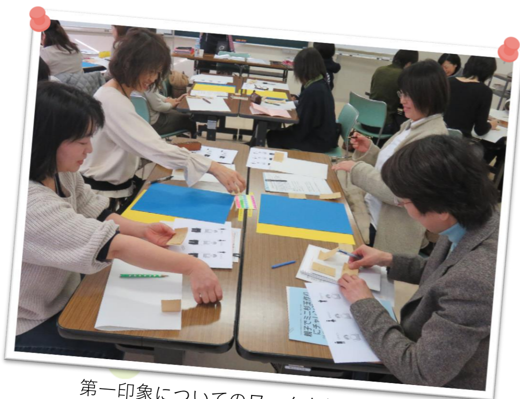
第一印象についてのワークを行います。