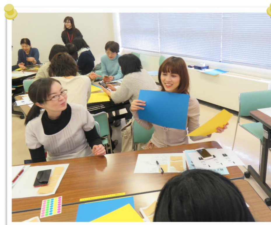
肌に合う色についてのワーク。