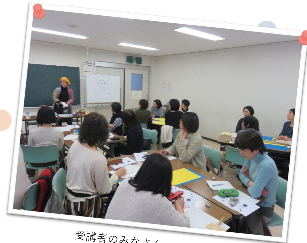
受講者のみなさん。