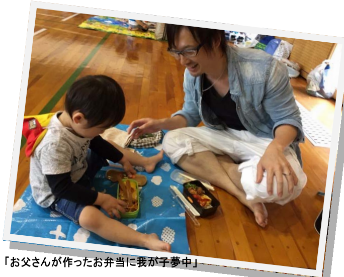
「お父さんが作ったお弁当に我が子夢中」