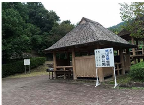
梶山古墳案内看板