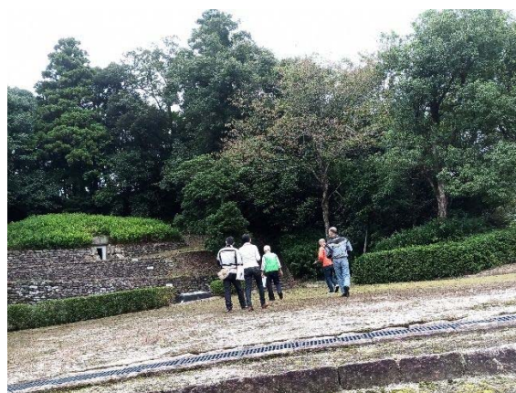
梶山古墳ガイド案内