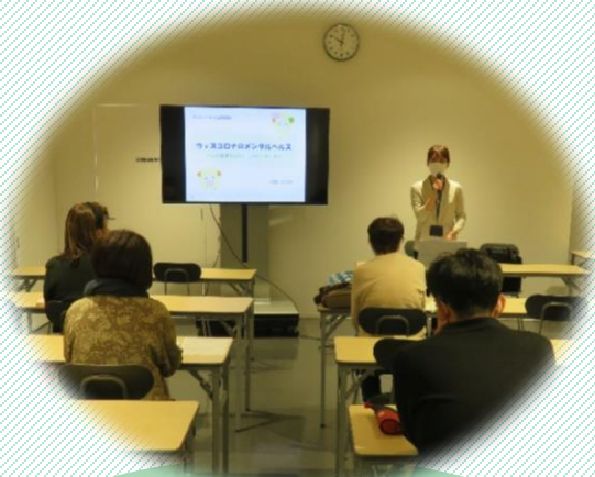
講師 鳥取市保健所 心の健康支援室保健師