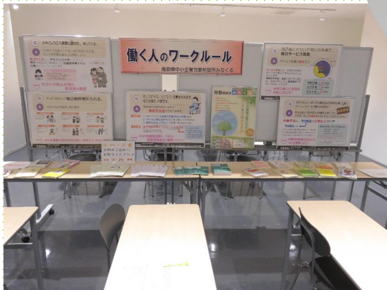
パネル展示の様子