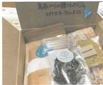
プチ定期便 (エモボ)