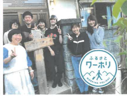
ふるさとワーキングホリ デーの受入れ