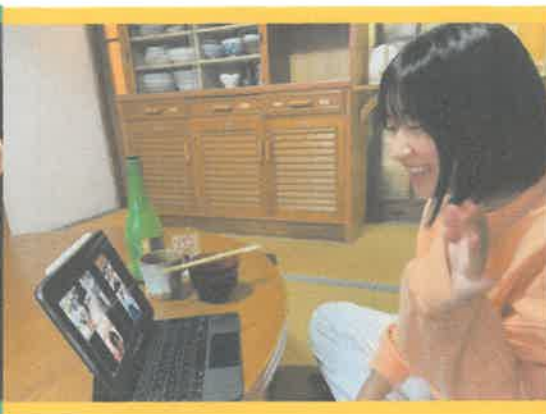
鳥取とつながる Z世代コミュニティ事業