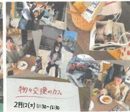
次世代の応援 (みんなの貯金箱)