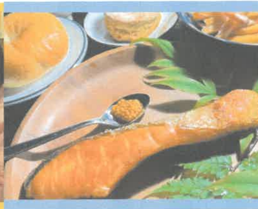
食を通じて鳥取と つながるEC事業