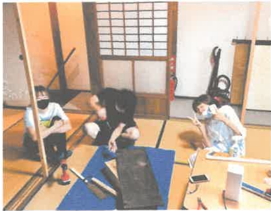
県内学生の 居場所づくり

空き家2軒をDIYでリノベーションし、宿&コミュニティスペースを運営。 地域の暮らしに溶け込む中長期滞在をコーディネートし、 県内外のZ世代がいつでも“ただいま”と帰れる場所を目指しています。