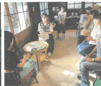
スキルシェア (エモワクPJ)