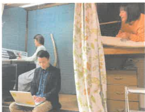
拠点シェア (もちがせ週末住人の 家／だいせん週末住人の 家・TORICO)

「ただいまと帰れる場所とつながりをシェアする」をコンセプトに、 滞在経験者を中心とした会員制のオンライン×リアルコミュニティを運営。 社会人は「ゆる会員／なかま会員(月額1,000円)」と関わり方を選ぶことができ、 学生会員はいずれの関わり方をすることもできます。