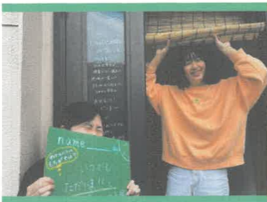
地域とつながる 拠点・交流事業

人口最少県・鳥取を拠点に、Z世代の関係人口を創出することで、 “だれもが自分と社会の未来にワクワクできる日常”を共創する企画会社です。