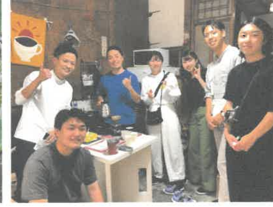
大学のゼミ合宿などの コーディネート