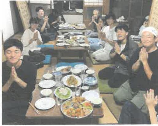
食事交流会 「週末なべ部」の開催