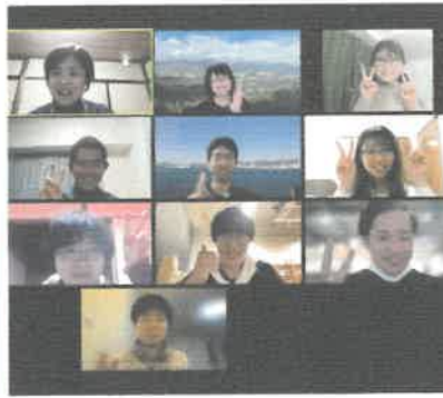
オンライン×リアルの コミュニティイベント (遠くdeさけ部／遠くdeトーク ／週末〇〇部／支部会／同 窓会)