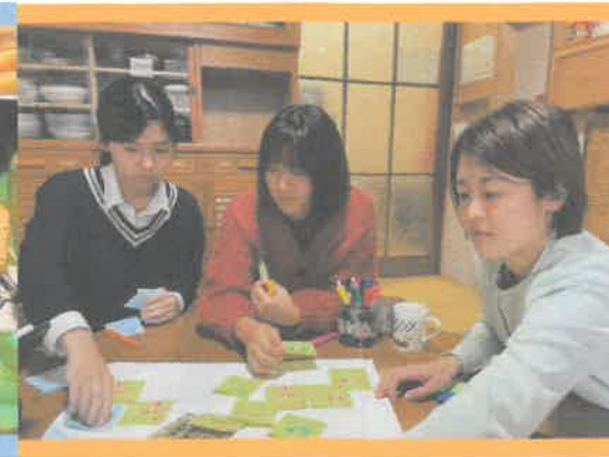
Z世代の視点を活かす 受託・協業事業