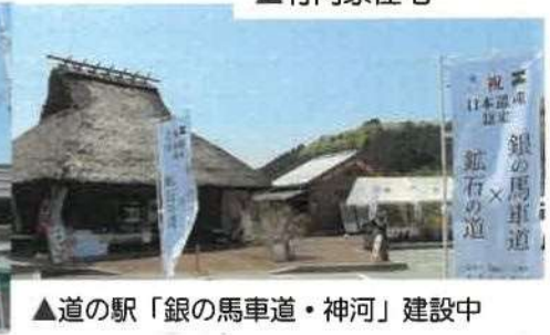
▲道の駅「銀の馬車道・神河」建設中