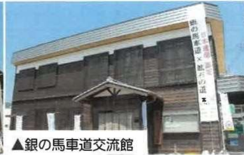
▲銀の馬車道交流館