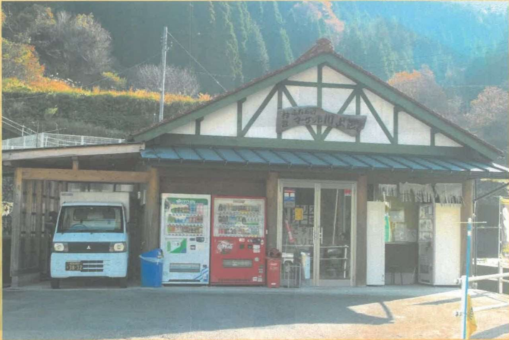
村営ふれあいマーケット川上店 平成20年2月オープン