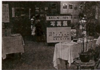
大丸で開かれた広報写真展（昭和35年8月）

広報の100号発刊に当たり「市民作品コンクール」の作品を募集。俳句、短歌、写真、論文、標語、詩に300点の応募がありました。賞品にカレーセットやライター、1席入選者には3,000円相当の花生けなどが贈られています。