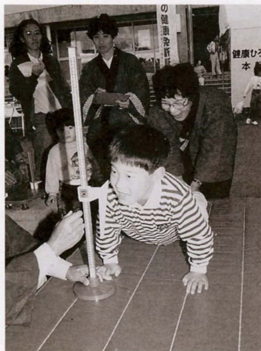
「健康ひろば」でチビっ子も体力測定に挑戦。お手伝いは健康づくり地区推進員さん