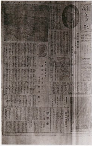
広報鳥取創刊号(タブロイド判) (昭和27年1月30日号)

市報は、昭和二十七年一月、一月までは、タブロイド判で百八「廣報鳥取」として創刊され、平成四年四月一日号で通算六百号を迎えます。発刊早々の二十七年四月、鳥取大火に見舞われたため、四月・五月号を休刊。しかし、六月には復刊し、以後、毎月一回のペースで発行しました。 市報は、昭和二十七年一月、一月までは、タブロイド判で百八「廣報鳥取」として創刊され、平成四年四月一日号で通算六百号を迎えます。発刊早々の二十七年四月、鳥取大火に見舞われたため、四月・五月号を休刊。しかし、六月には復刊し、以後、毎月一回のペースで発行しました。 創刊号から百七号（三十六年三月）までは、タブロイド判で百八号（三十六年四月）からはB5判になり、タイトルが「とっとり市報」となりました。さらに二百十六号（四十五年四月）からはA4判となり、三百四十八号（五十六年四月）の表紙が初めてカラー化されました。三百六十号（五十七年四月）からは、五月二回の発行となりました。五百三十号（平成元年五月）から一日号に二色刷りを採用。五百五十五号（二年五月）からは、五日号の中ページも二色刷りとなりました。