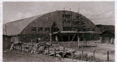
昭和33年、行徳に完成した市民体育館

敷地1,737坪の買収契約を10月末日で終了、最終設計書の到着を待っています。3月には威勢の良い建築が開始されようとする段階に達しております。」