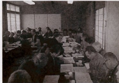
総会で来年度の事業計画を話し合う会員たち

毎年二月の例会は、大樹荘で総会を開きます。今年、バスで青島公園前へ行き、そこから大樹荘まで歩きました。 当日(二月九日)は、朝から雪模様。午前八時四十分、鳥取バスターミナルで吉岡行きの定期バスに乗る時はものすごい雪が降ってきました。「今日は積もるね」と話しながらバスに