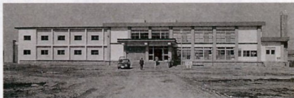
完成したばかりの大樹荘(昭和43年9月1日撮影)

老人福祉施設「大樹荘」の完成▽鳥取市の発展を記録した「伸びゆく鳥取市」の制作▽鳥取市の木に「サザンカ」の決定▽総合グラウンド「野球場」の完成▽待望の公共下水道の運転開始▽農村道舗装▽教育施設の充実などを写真で紹介。