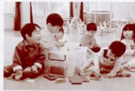
おもちゃで遊ぶ園児 めぐみ保育園